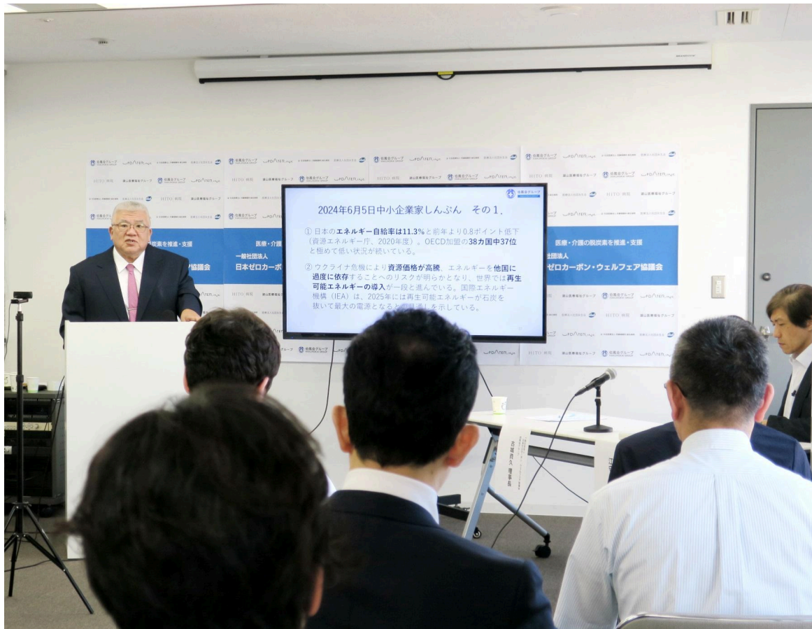
▲セミナー当日の会場の様子